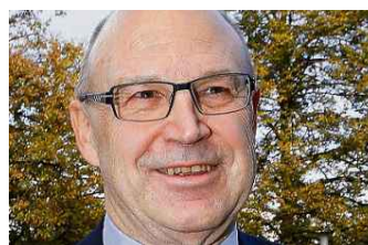
«Cham profitiert auf mehreren Ebenen.»