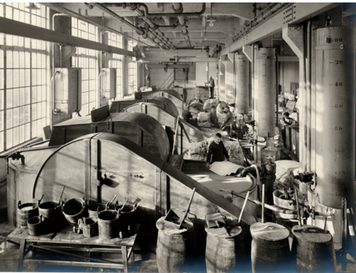
Der Holländer-Saal in der Papiermaschinenhalle 3 um 1914.